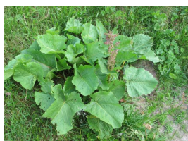
Rhubarbe des moines

2 – Après avoir traversé le torrent par la passerelle, tu peux observer les plantes qui t'entourent. Entoure le nom de celles rencontrées :